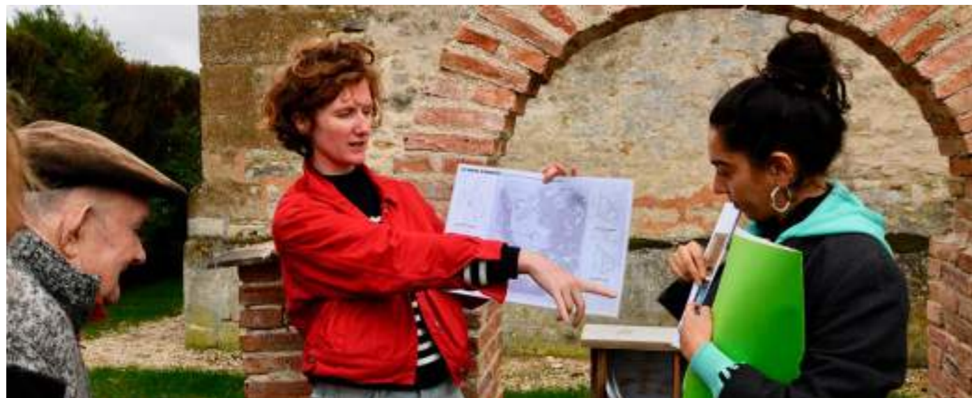
Archives d'ici - 2022 © Anne Der Haroutiounian et Élise Boutié

Le Réseau des maisons de l'architecture relayera l'actualité des résidences en cours sur ses réseaux sociaux et sur son site internet.