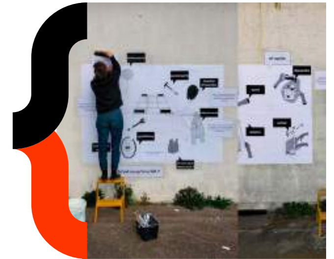
Tabula non Rasa - 2024 ©Marion Lacas et Jacques Ippoliti

Afin de permettre à tous de suivre le déroulement des résidences, chaque équipe créera et alimentera un site/blog dédié à la résidence et pourra produire un support de synthèse présentant leur démarche et leurs réalisations.