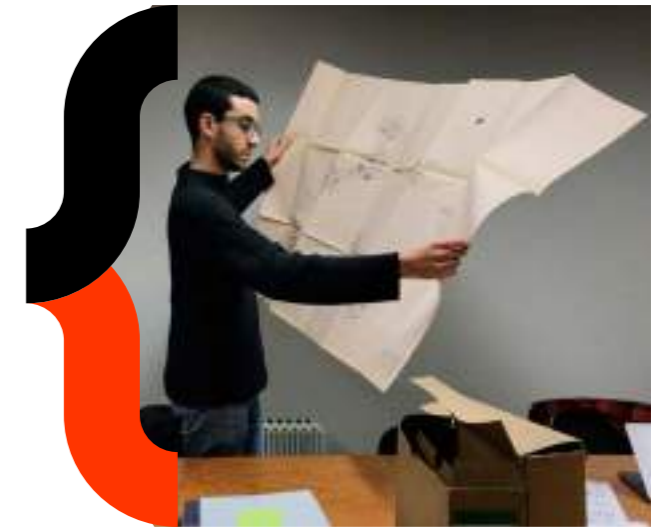
Bonneville - Le quartier des îles - 2020

L'équipe qui les entoure peut être à géométrie et professions variables, offrant ainsi des points de vue et des méthodes de travail variés et complémentaires .