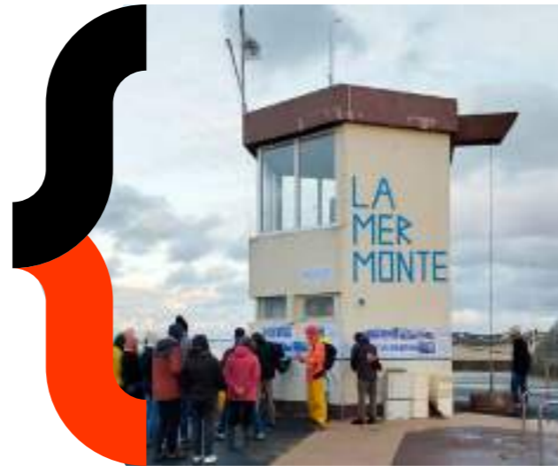
Laboratoire du littoral - Bessin - 2024

En 2025 , le Réseau des maisons de l'architecture, grâce au mécénat de la Caisse des dépôts, lance un nouveau programme qui vise à travailler , par le prisme de l'architecture, du paysage et du cadre bâti, sur des thématiques engagées autour de questions environnementales et sociales , de résilience, de ménagement des territoires, de transition écologique, de mutations architecturales en impliquant toutes les actrices et tous les acteurs au contact de tous les publics.